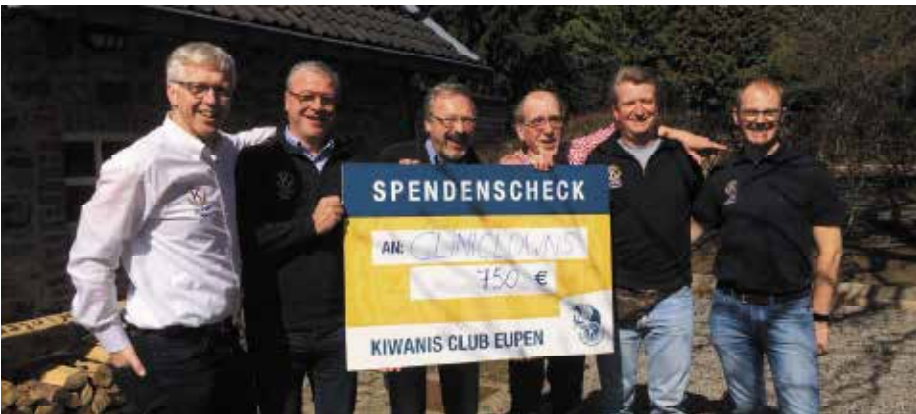
Remise Cheque CliniClown

partie déjà «anciens». L'esprit «Kiwaniien» en eux est resté jeune, ils participent activement aux événements et aident très efficacement dans les commissions. Par ce comportement actif, ils soutiennent l'intégration des nouveaux membres dans le club. Que les membres du Kiwanis Eupen soient jeunes ou vieux, membres nouveaux ou de longue date, ils regardent tous dans la même direction, à savoir aider ensemble les enfants dans le besoin !