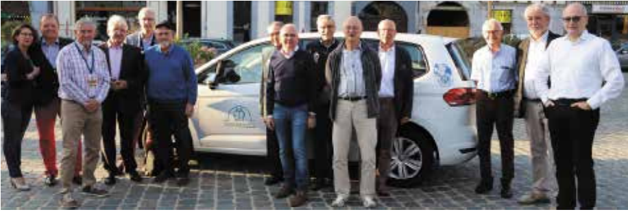
Remise de voiture pour Josephine Koch Stiftung

et créatifs. Lors de l'exercice 2018/2019 nous avons organisé un concert de musique avec le groupe «Shabby Chic's». Un succès total, car deux semaines avant la date du concert, nous étions « sold out »! Maintenant, bien sûr, nous réfléchissons à la façon de planifier notre prochain concert de musique.