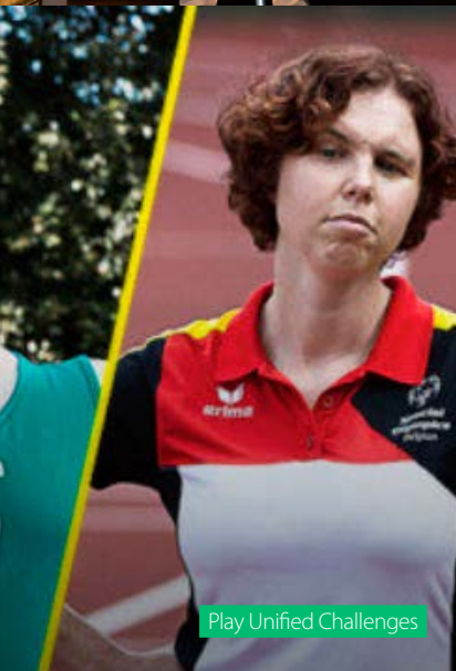
Play Unified Challenges