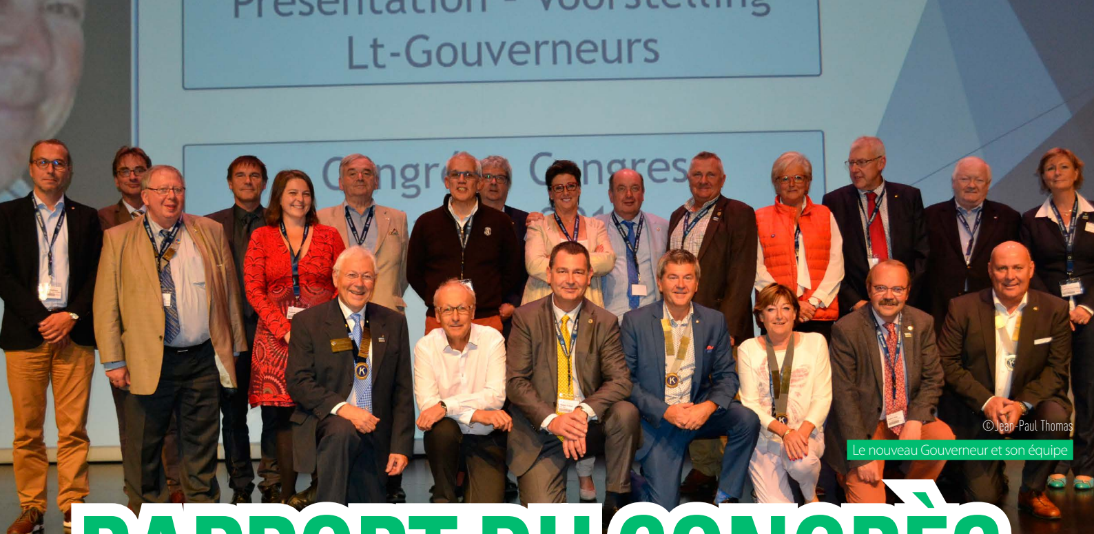
Le nouveau Gouverneur et son équipe