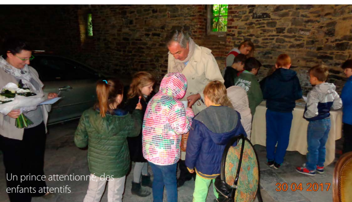
Un prince attentionné, des enfants attentifs

En Mai, les membres ont participé à une journée pédagogique en accompagnant un groupe d'enfants au château d'Antoing. La présence active du propriétaire, le Prince de Ligne, y apporta une dimension supplémentaire appréciée de tous.