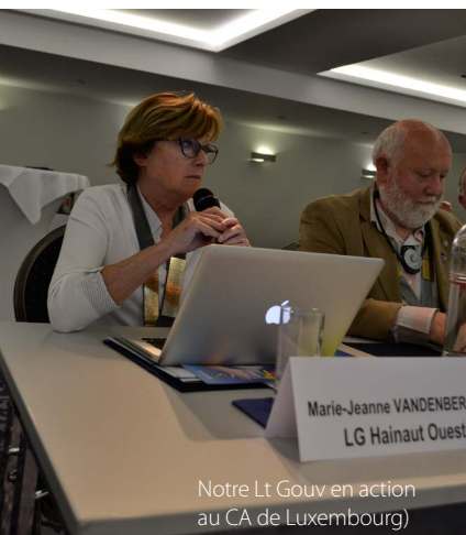
Notre Lt Gouv en action au CA de Luxembourg

Elle a été ponctuée par un départ fulgurant.