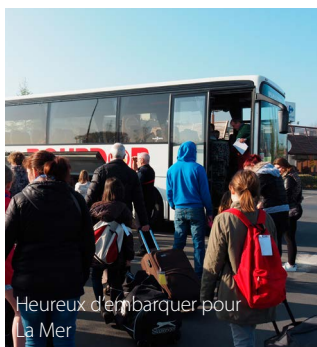
Heureux d'embarquer pour La Mer

N'oublions pas le quartier St-Piat. Du lait a été offert