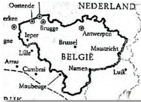
De laatste grenswijzigingen