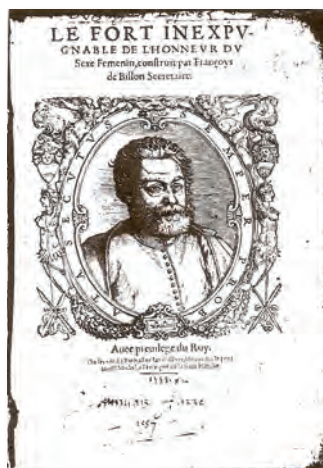
Original de la couverture du livre de François de Billon "Le fort inexpugnable de l'honneur du sexe féminin."

Selon Émile Littré, « Les Grecs distinguaient les prénoms athées (par exemple Platon) et les prénoms théophores (par exemple Dionysos) ». Un prénom « athée » est donc simplement un prénom « laïc », qui ne se réfère pas à la religion.