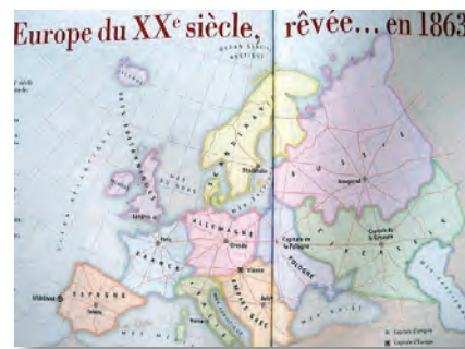
België 'van de kaart'