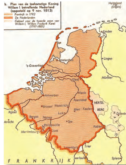
Het plan van Willem I