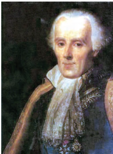
Pierre-Simon de Laplace (1749-1827), mathématicien, astronome et physicien. Il est le symbole de l'athéisme scientifique

Les progrès de la science, entre le 16e et le 18e siècle, soit de Copernic aux Lumières, permettent d'expliquer l'univers de manière de plus en plus satisfaisante sans recours à aucun dieu de type biblique, comme le montre l'échange célèbre 2 :