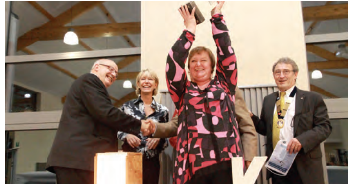
La remise du Challenge aux « Cerveaux Lents ». Une équipe non kiwanienne pour qui c'était une première.