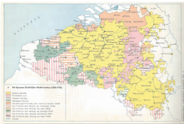
De Spaanse Nederlanden