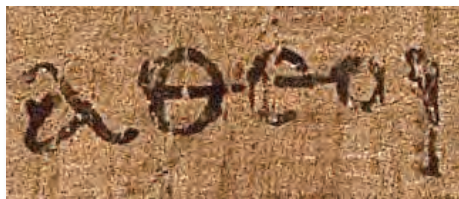
« atheoi » dans la lettre aux Éphésiens (2,12) attribuée à Paul de Tarse - Papyrus 46 du début du III e siècle.

L'athéisme peut être considéré comme une attitude ou une doctrine qui affirme l'inexistence de quelque dieu ou divinité ou entité surnaturelle que ce soit. Donc l'athéisme est une croyance au même titre que les autres que je vous ai déjà présentées. Au contraire du déisme, du théisme et du panthéisme qui soutiennent ces existences, ou à l'agnosticisme qui est, lui, la doctrine qui considère que l'absolu est inaccessible à l'esprit humain et qui préconise le refus de toute solution définitive aux problèmes métaphysiques. C'est une position philosophique que l'on peut formuler ainsi : dans l'Univers et dans l'état actuel des sciences et des connaissances, il n'existe rien qui ressemble de près ou de loin à ce que les croyants appellent Dieu. Mais cette philosophie – et c'est vraiment fondamental – ne nie nullement la possibilité qu'un jour, proche ou éloigné, un élément permettra de le prouver.