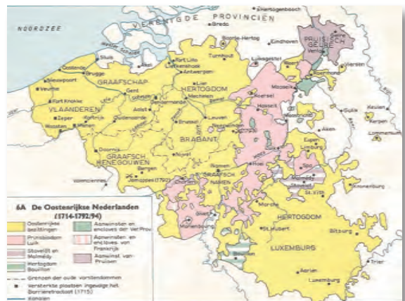
De Oostenrijkse Nederlanden