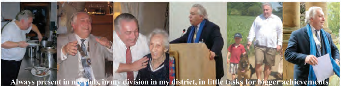
Always present in my club, in my division in my district, in little tasks for bigger achievements.

Ik wens op deze thema's te werken, antwoorden vinden met de clubs en de leden, jullie projecten en realisaties promoten, Kiwanis belux vertegenwoordigen binnen onze beweging maar ook buiten om aan onze organisatie de omvang dat ze verdient te verlenen. Ik denk het, ik meen het, ik leef het hedendaags met mijn thema:»Kiwanis, the key to success» Dank u voor uw steun in Kortrijk ! Aarzel niet om te reageren: a.borguet@skynet.be