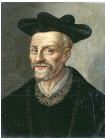
François Rabelais, humaniste français du XVI e siècle

La Renaissance a permis l'expansion de la liberté de pensée et du scepticisme. On peut alors citer par exemple Léonard de Vinci, qui indiquait que l'explication venait de l'expérimentation, et opposait ses arguments aux autorités religieuses.