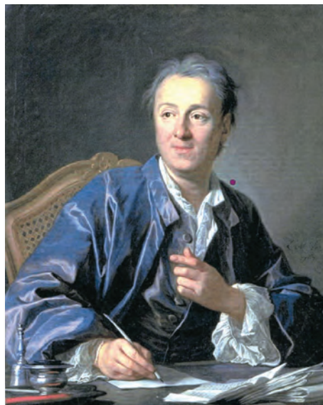
Denis Diderot remet en cause les dogmes du catholicisme.