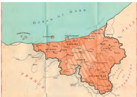
Sint-Truiden aan zee.